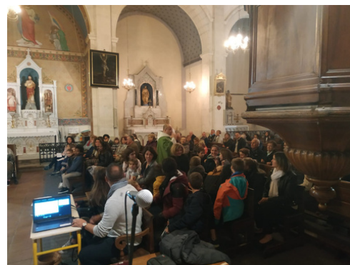
Messe du samedi à l'église d'Althen